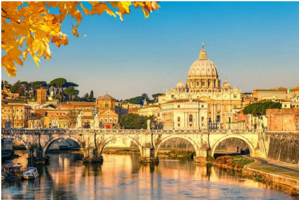
prezzi delle case nelle grandi città