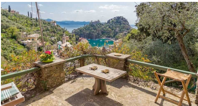
Villa dei Tre Mari – Portofino