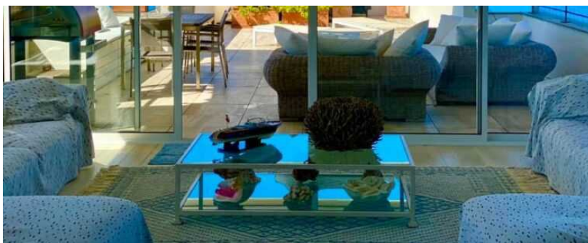
Villa Prua del Mare – Zoagli