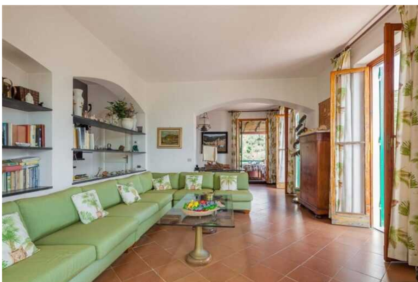
Villa dei Tre Mari – Portofino

A Portofino, si confermano molte richieste per la locazione di ville con piscina sebbene l'offerta sia scarsa. Per i mesi di luglio e agosto qui si registrano i canoni più elevati della zona, con valori in aumento rispetto allo scorso anno, anche sui 20.000 euro a settimana in cui sono inclusi servizi come, ad esempio, il personale, lo chef e l'ormeggio barca. Per questo tipo di immobili , il cliente per la locazione è generalmente la famiglia alla ricerca di una villa di 10-12 posti letto complessivi per invitare anche gli amici.