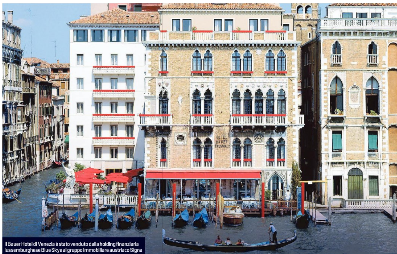
Il Bauer Hotel di Venezia è stato venduto dalla holding finanziaria lussemburghese Blue Sky al gruppo immobiliare austriaco Signa